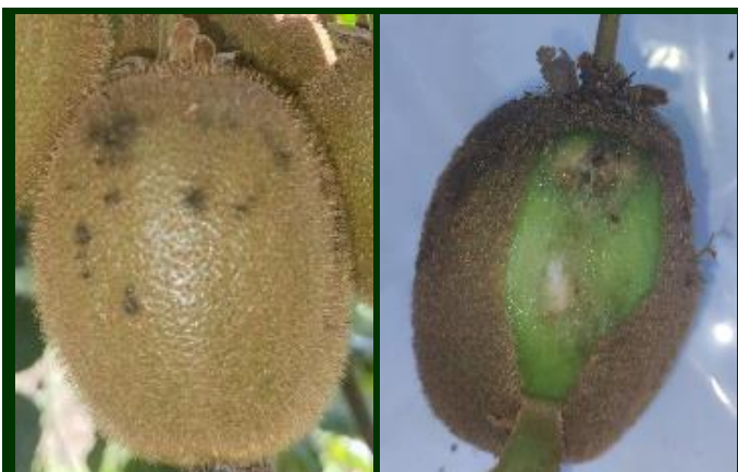
Fig. 2. Estragos resultantes da atividade alimentar das ninfas e dos adultos do percevejo asiático

Para saber mais sobre esta praga, consulte aqui a Circular nº 13/2025.