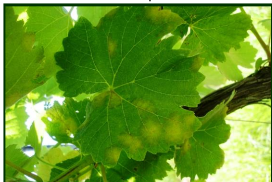
Figura 1. Sintomas de míldio na folha (“manchas de óleo”)

Não mobilize o solo nesta altura , para reduzir os salpicos da chuva que venha a ocorrer e que transportam os esporos do míldio para as folhas e pâmpanos da videira. Pelo contrário, o revestimento do solo com vegetação rasteira, bem cortada, absorve o impacto da chuva e reduz ou anula os salpicos.