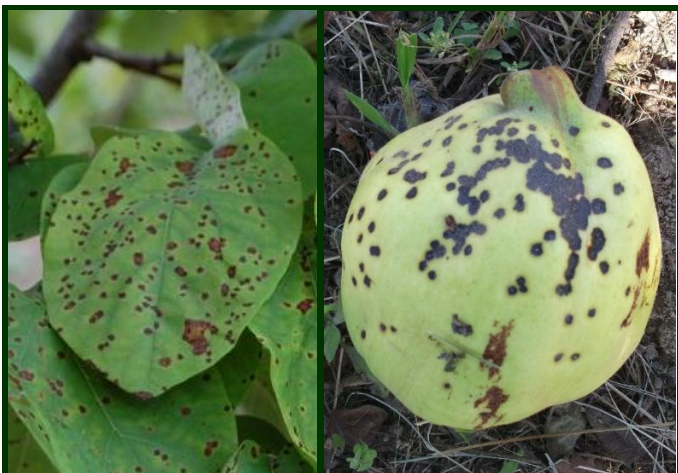
Fig. 3. Sintomas de entomosporiose nas folhas e no fruto

No final da floração, depois da queda das pétalas, pode aplicar um fungicida, nos marmeleiros que são habitualmente atacados pela entomosporiose.