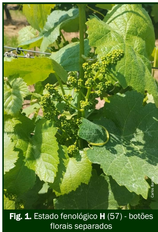
Fig. 1. Estado fenológico H (57) - botões florais separados

No combate ao míldio em vinhas no Modo de Produção Biológico e Convencional, estão autorizados os produtos indicados nos Quadros 1 a 1.7 (anexo).