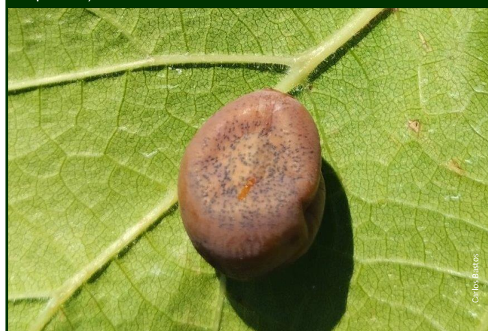
Fig. 6. Picnídeos de black rot no bago (imagem muito ampliada)