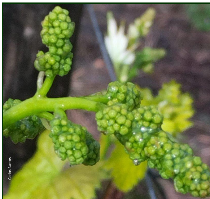
Fig. 4. Na fase de pré-floração, a persistência de película de água sobre a inflorescência, favorece o desenvolvimento da Botrytis .

No Entre Douro e Minho, em condições adversas (chuvas persistentes), a partir da fase de cacho visível poderá haver necessidade de antecipar o primeiro tratamento deste método.