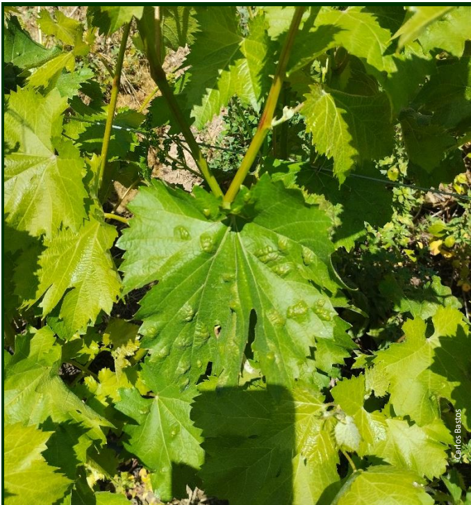
Fig. 2. Erinose na folha (face superior)

Sendo o período de pré-floração – alimpa um período de risco, recomenda-se a utilização de um anti-óidio, como por exemplo, o enxofre, que tem ação sobre a erinose , muito presente, nos últimos anos, nas vinhas de Entre Douro e Minho.